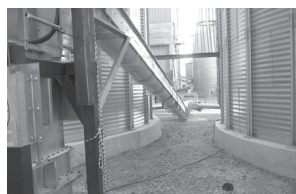
TRANSPORTADOR DE INCLINACIÓN