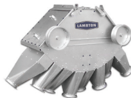
DISTRIBUIDOR DE PÉNDULO