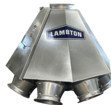
DISTRIBUIDOR DE ESPALDA PLANA