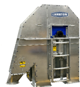
ELEVADOR DE CANGILONES