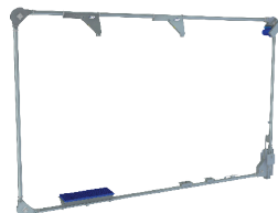
BUCLAS DE GRANO